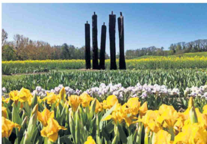
Les premiers iris s'offrent au regard des «géants» du sculpteur Christian Lapie dans la partie extérieure des jardins.

Du sa 10 mai au di 22 juin Tlj (9 h-18 h) Rens.: 079 274 79 64 www.jardinsdesiris.ch