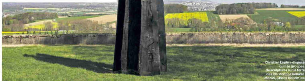
Christian Lapie a disposé quinze groupes de sculptures sur la terre des iris, dont La lumière du ciel , (490 x 160 cm) en