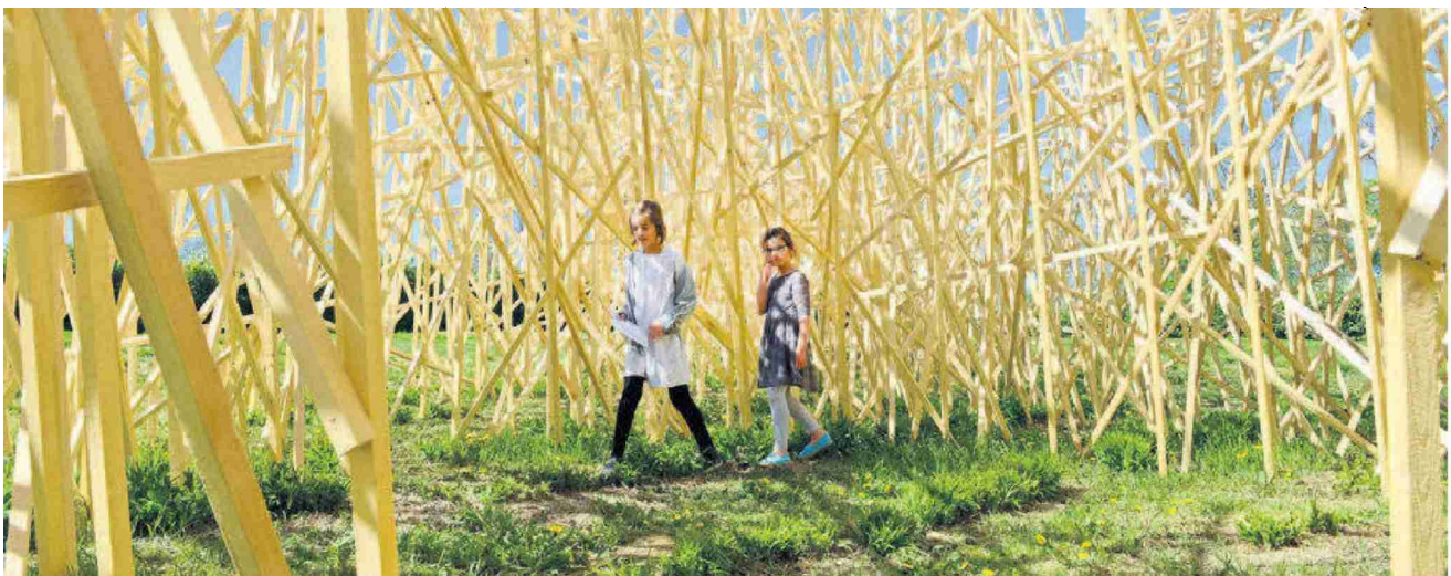
Le «Paradigme» créé par la sculptrice genevoise Mireille Fulpius est formé de plus de mille lambourdes d'épicéa assemblées sur une longueur de 40 mètres.

Les Florales de Vullierens ont 60 ans et accueillent Beverly Pepper et Mireille Fulpius. Spectaculaire